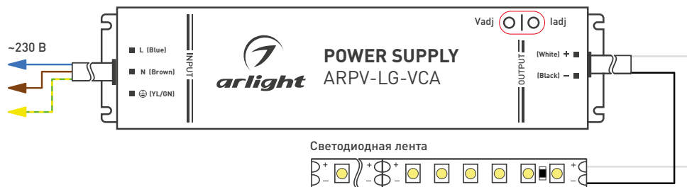
Рис. 1. Пример подключения источника питания