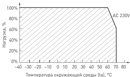
Рис. 3. Максимальная допустимая нагрузка, % от мощности источника